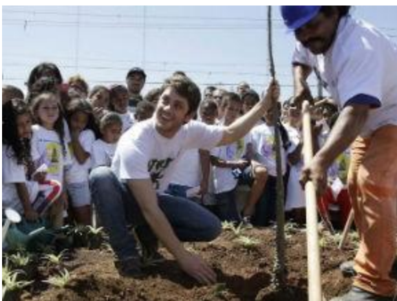
Mutirão do Verdejando no Horto Florestal / SP.